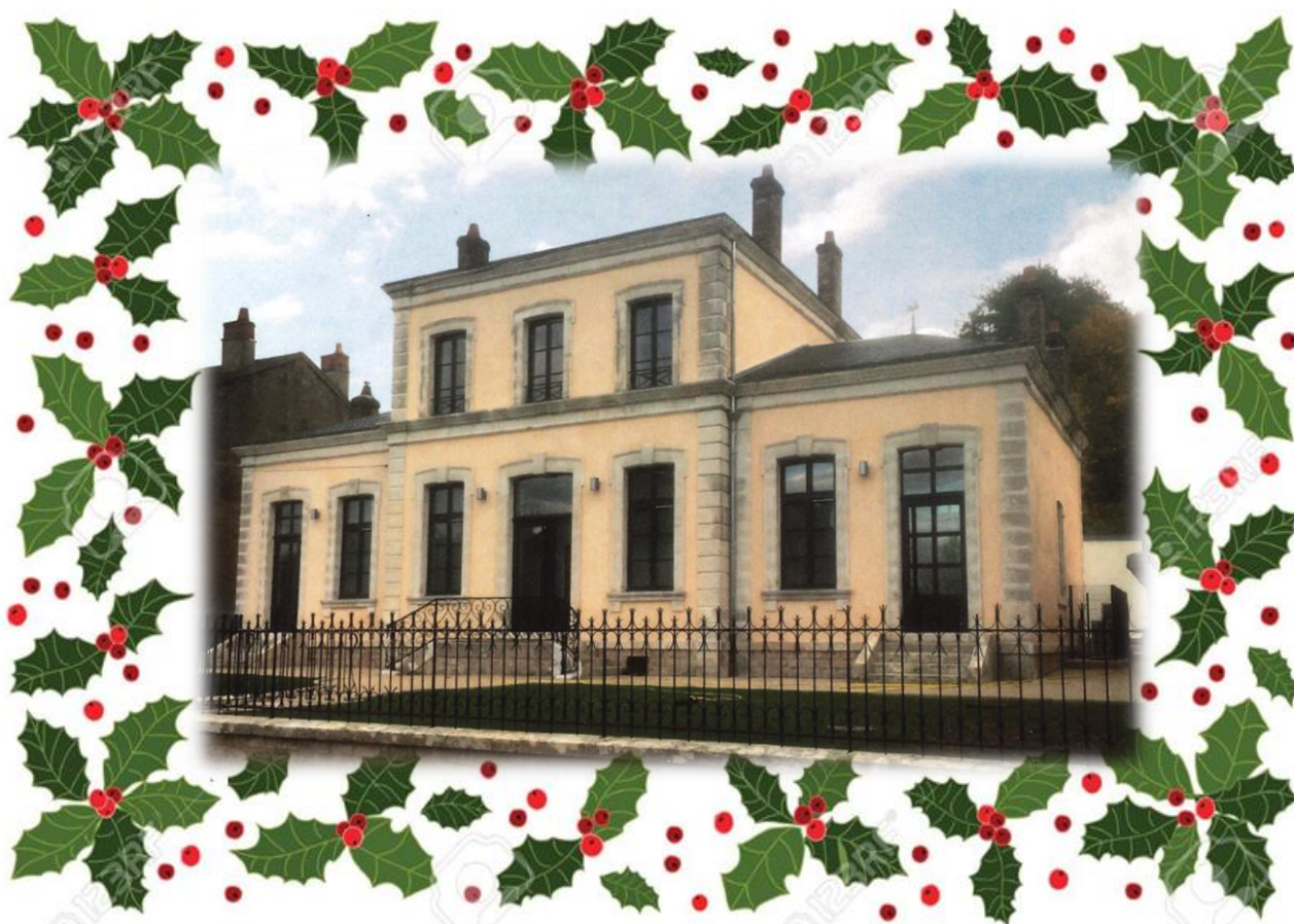
Pôle Santé Bruno Faure, à Châtel-Censoir. Décembre 2018.